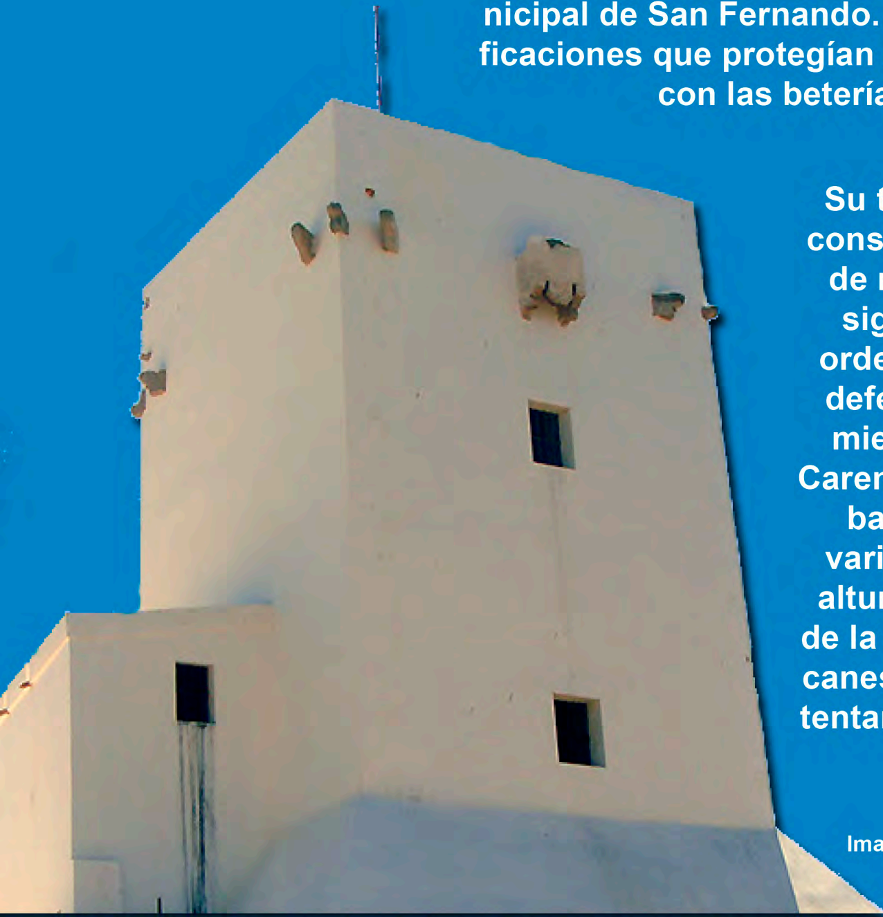
Imagen de la torre almenara.

Su torre almenara o atalaya atunera es la construcción más antigua (1610) y el resto de murrallar e interior del recinto son del siglo XVIII. La torre fue construida por orden de Felipe II, con una doble función: defensa de la almadraba y para el avistamiento de naves de piratería beberisca. Carente de cimientos consta de una robusta base tronco-trapezoidal con muros de varios metros de grosor para sostener la altura de la misma, y resistir los impactos de la artillería. Destacan los restos de meta-canes en los ángulos superiores como sustentantes de voladizos, para sostener primitivas piezas de artillería.