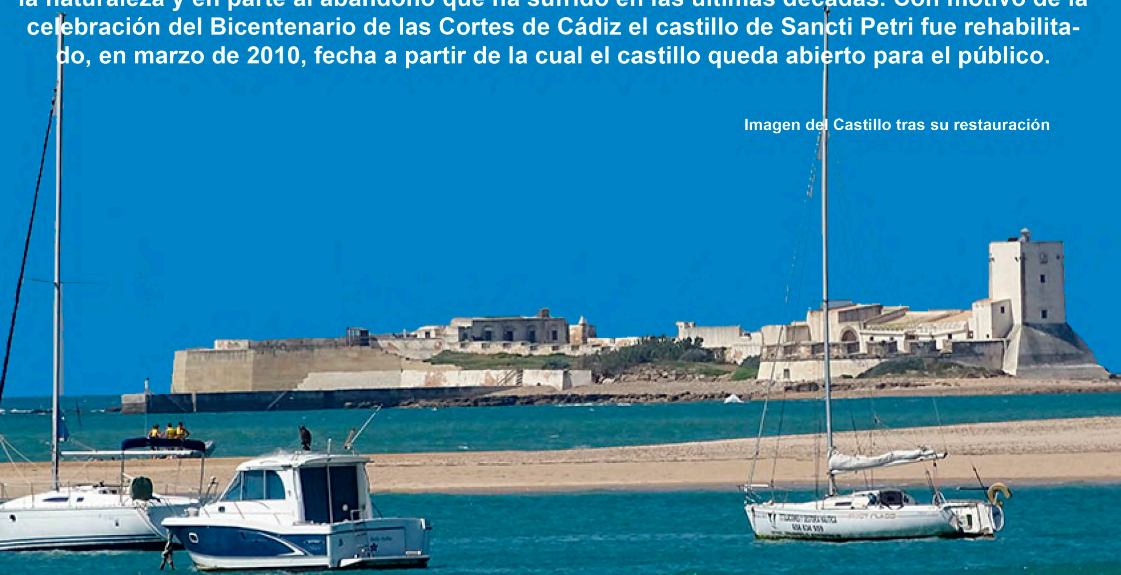
Imagen del Castillo tras su restauración

El castillo se encontraba en un avanzado estado de deterioro, debido en parte a la acción de la naturaleza y en parte al abandono que ha sufrido en las últimas décadas. Con motivo de la celebración del Bicentenario de las Cortes de Cádiz el castillo de Sancti Petri fue rehabilitado, en marzo de 2010, fecha a partir de la cual el castillo queda abierto para el público.